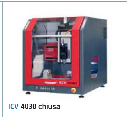
ICV 4030 chiusa